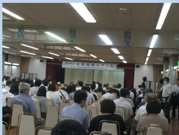
第2日 鬼怒川パークホテルズにて

本校は、進路指導とPTA分科会に参加して、千葉県立白井高等学校及び茨城県立桜ノ牧高等学校常北校の2校によるPTAと学校との連携について研修しました。