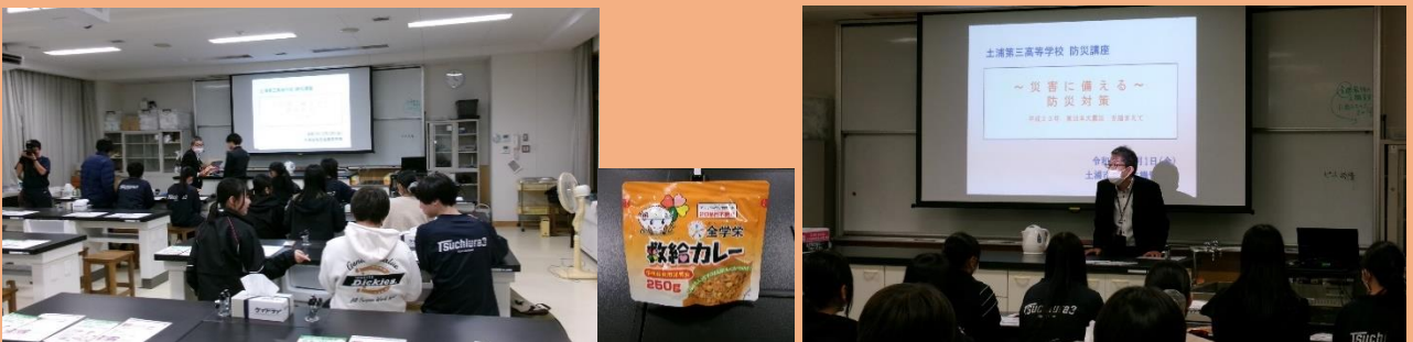
（土浦市防災課の職員さんから講話をいただきました。）

東日本大震災から10年以上が過ぎ、当時はまだ幼かった子供たちも立派に高校生となり、災害を振り返り、あらためて防災についての意識を高める機会となりました。