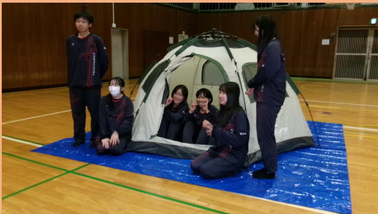
(未完成のテントをバックに)