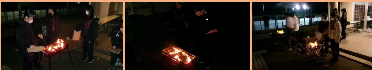
(岩田ヶ丘 (合宿所) 前にてコンロ3つでバーベキュー)

バーベキューコンロの炭に火をつけ火が回り網の温度が上がったことを確認して、フランクフルトや牛肉、野菜などを焼き、最後に網を鉄板に置き換え、残った野菜と肉を炒め、焼きそばを加えて美味しくいただきました。